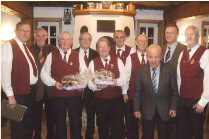
Der Männergesangverein Bersenbrück (MGV) war im Heimathaus „Feldmühle“ auf Einladung des Heimatvereins zu Gast