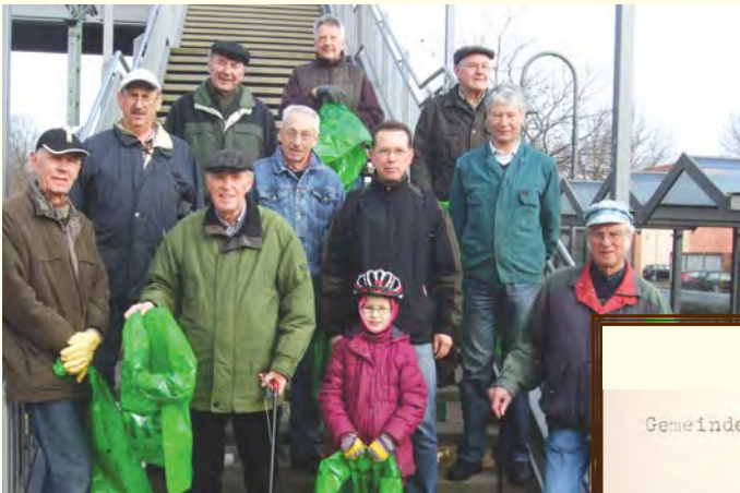
Der Heimatverein führte zusammen mit mehreren Vereinen und Gruppen wieder die Umweltschutzaktion „Unsere Stadt soll sauber werden“ durch