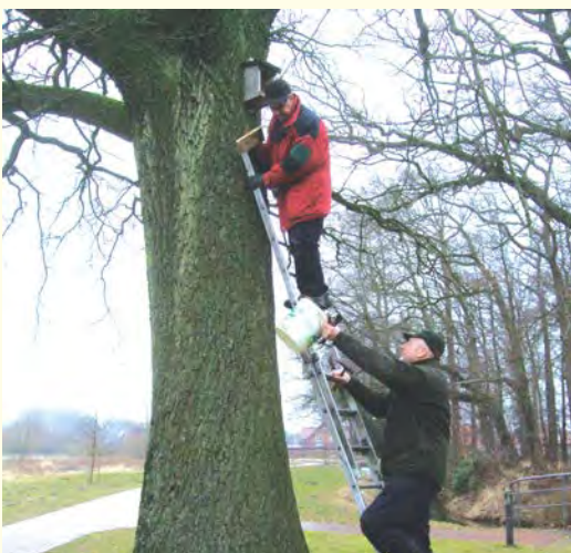
Die in den letzten Jahren aufgehängten Nistkästen wurden gereinigt