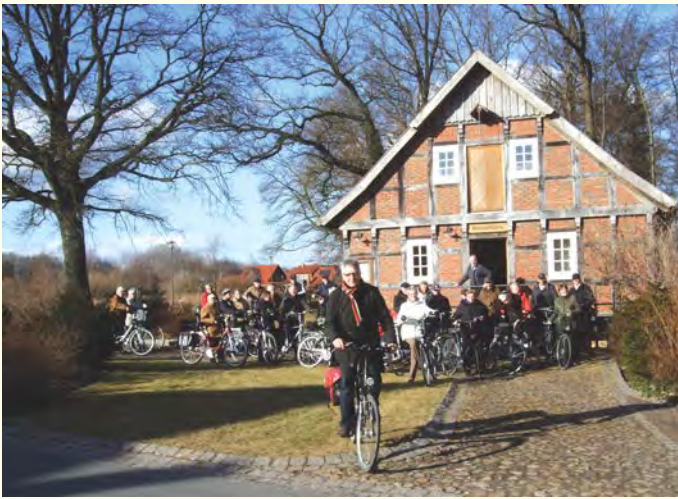
Die Radwandersaison 2012 wurde eröffnet, ein Grünkohlessen schloss sich an