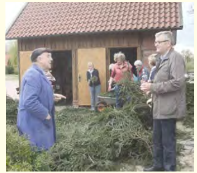
Die Damen der TuS Gymnastikgruppe flochten wieder den Bänderkranz für den Maibaum, der im Rahmen der Brauchtumpflege auf dem Marktplatz aufgestellt wurde