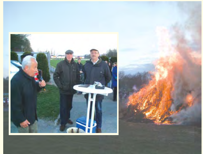
Mit dem Abbrennen eines Osterfeuers pflegte der Heimatverein das Brauchtum