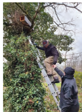
Anbringen von Steinkauzröhren im Umfeld des Heimathauses Feldmühle