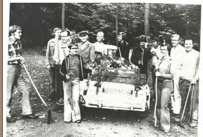
1. Umweltschutzaktion des Heimatvereins Bersenbrück in der Hemke