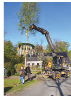
Aufstellen des Maibaums am Heimathaus Feldmühle