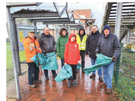
Müll-Sammelaktion des Heimatvereins Bersenbrück

Einladung zur Tagesfahrt am 31. August 2023 u.a. zum Heimathof Wilsun/Grafschaft Bentheim