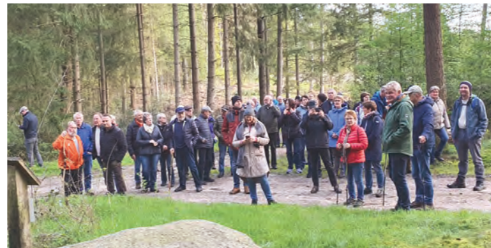
Teilnahme an der Frühwanderung des Kreisheimatbundes Bersenbrück am 1. Mai in der Maiburg/Bippen