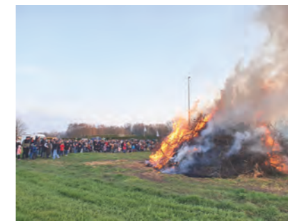
Abbrennen eines Osterfeuers am Flutwehr