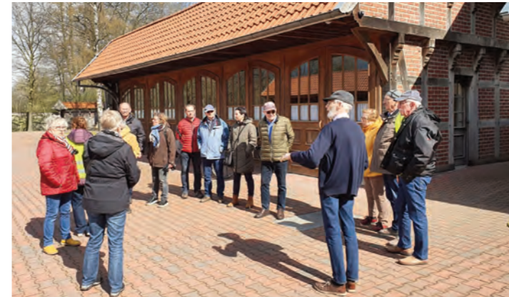
Radwanderung zum Bestattungsinstitut Lemke in Gehrde